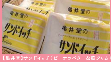
【亀井堂】サンドイッチ(ピーナツバター&苺ジャム)