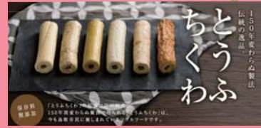
【ちむら】とうふちくわ